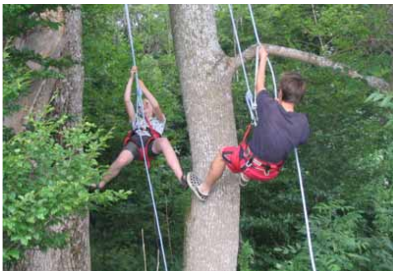
Der blev gået til den og spejderne blev mere og mere frie i deres bevægelser i træerne

Polakkerne var lidt sene til at vænne sig til tanken om at sove i træer, men da de først havde opdaget glæderne ved træklating var de heller ikke til at stoppe.